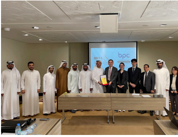
IBITA - Dubai BPC MOU