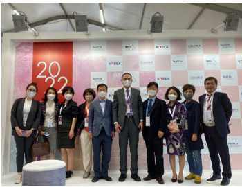
Cosmoprof Worldwide Bologna 2022