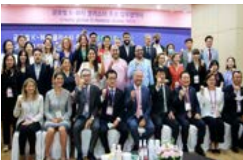
〈GCC대표단 충북 컨퍼런스 및 1:1 바이어 매칭〉