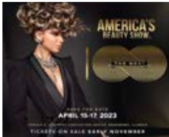
〈100년 전통의 아메리카뷰티쇼 포스터〉