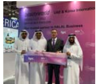
〈두바이 FCI그룹 회장 및 임원 BPC & IBITA 공동관 기념〉