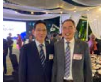
〈중소기업인대회 SAMSUNG Group 이건희 회장 & IBITA 운주택 회장〉