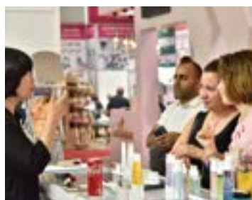
〈터키 유라시아 박람회 IBITA한국관 상담전경〉