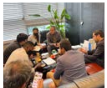
〈IBITA주관 UAE BPC 한국제품 기업매칭 수출상담회〉