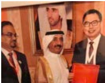
〈H.H.셰이크 하서 빈 막툼 통치자로 부터 감사패전달〉