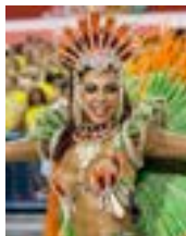
〈브라질 삼바 축제〉

브라질 뷰티페어는 세계 2위 규모, 중남미 최대 규모 뷰티분야 전시회로서, 브라질 내수시장 뿐만 아니라 중남미 진출을 위한 반드시 필요한 전시회이다. 정부지원 또는 개별 바우처를 활용하거나 지자체 지원을 받아 참가를 하게 되면 참가비가 많이 절감되는 기업의 부담을 줄여주는 효과가 있으나 각 유관기관 지자체의 수출기업 지원을 위한 많은 지원이 아쉬운 것이 현실이다.