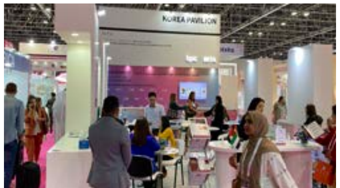
〈2022 두바이 뷰티월드 IBITA & 두바이 BPC 지원센터 공동 홍보관〉