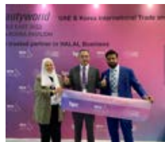
〈사우디뷰티월드 한국대표 IBITA〉