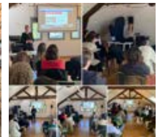
〈2022 GCC19개국 온·오프라인 총회 및 컨퍼런스〉