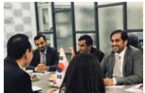
〈UAE경제 사절단 IBITA방문 협약 후속조치 위한 회의〉