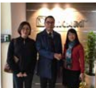
〈베트남 IBITA 파트너사 방문〉