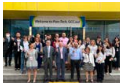
〈제1회 미션코리아 GCC19개국 35명 대표단 한국 산업체 시찰〉