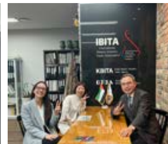
〈일본JCC 코스메틱벨리 실무대표단 IBITA방문 협약체결관련 사전협의〉