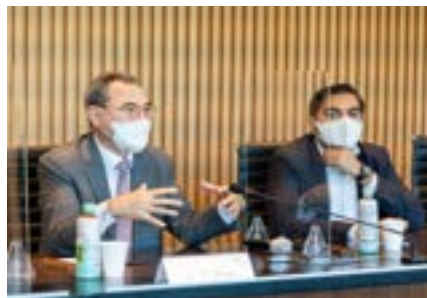
〈두바이BPC회장과 함께 중동지역 수출을 위한 사전 설명회개최〉