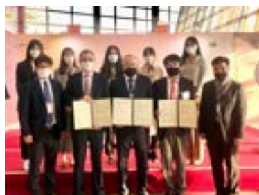
〈충북화장품임상연구지원센터 & (사)충북화장품 산업협회 & 국제뷰티산업교역협회 MOU 체결〉