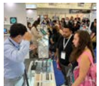
〈IBITA관 라스베가스 코스모프르프 바이어 상담 전경〉