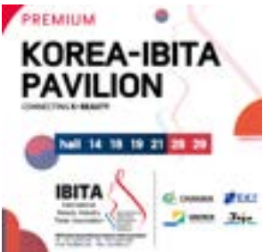
〈2023 이태리 볼로냐 코스모프르프 IBITA한국관 홍보포스터〉