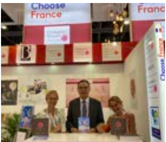
〈두바이 뷰티월드에서프랑스 GCC코스메틱 벨리 홍보부스 방문〉