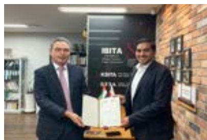
〈UAE FCI그룹회장 IBITA 명예회장으로 임명〉