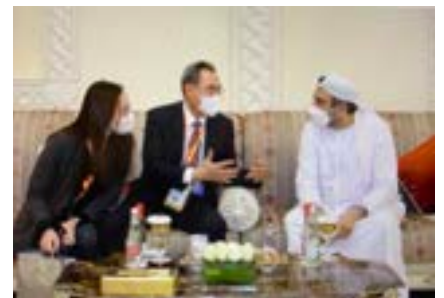
〈인덱스 수석부회장과 두바이 더마박람회 관련 환담〉