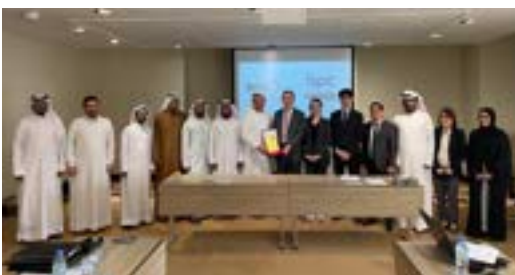
〈두바이 BPC & IBITA 한국기업지원센터 임직원〉