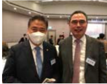
〈새로운 미래 30년포럼에서 박진 외교부 장관과 IBITA 운주택 회장〉