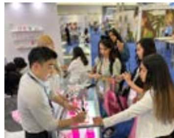
〈라스베가스 IBITA관 바이어 상담 부스전경〉