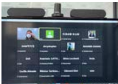
〈GCC(Cosmetic Clusters) 19개국 IBITA주관 온라인 화상 컨퍼런스〉