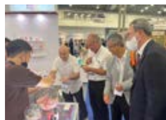
〈GCC19개국 대표단과 라스베가스 코스모프로프 IBITA관 순회〉

윤 회장은 “이번 Cosmoprof North America 2023” IBITA한국관 참가사 모두 좋은 성과 거두고 안전하게 귀국할 수 있도록 미국 현지 파트너와 세밀한 사전체크도 한국관 주관사의 중요하게 협력해야 할 역할이다.”라고 하며, “IBITA한국관 참가사들이 좋은 성과를 얻어 안전하게 귀국 할 수 있도록 최선의 협력과 지원을 다하겠다”고했다.