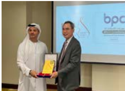
〈두바이에 한국기업지원센터 설립 및 두바이 FCI그룹과 IBITA 업무협약 체결〉