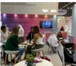
〈2022 두바이뷰티월드 KOREA IBTA & UAE BPC 공동 홍보관〉