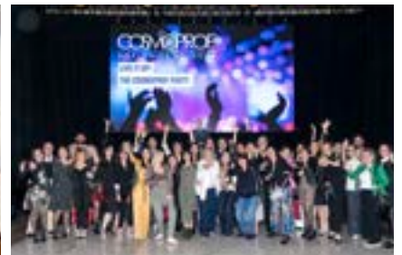
〈Cosmoprof Bologna Team〉