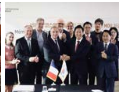
〈서울시와 프랑스 코스메틱벨리 업무협약 체결 GCC 한국대표부IBITA 서울미션코리아 통한 가교역할〉