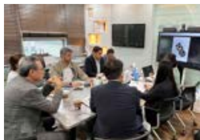
〈IBITA주관 UAE BPC 한국제품수출상담회〉