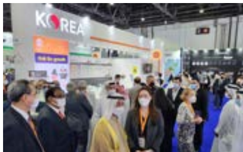
〈두바이더마 박람회 (중앙) H.하세이크하셔 빈막툼과 두바이 정부관계자 한국관 관심 가져〉