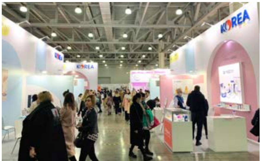
〈2022년 해외전시회 IBITA한국관 전경〉

코로나19 상황으로 인한 전시회 스탠드 중 국가관 참가는 한국관이 유일 한데다가 다양한 화장품 뷰티 제품을 확인할 수 있어 멕시코 바이어와 해외 참관객들의 모든 이목을 IBITA한국관에 집중시켰다. 멕시코는 코로나 안정기에 접어들면서 개인관리 및 위생에 대한 관심이 높아졌고 좋은 품질과 가격 경쟁력을 갖춘 한국 화장품 뷰티 제품에 대한 선호도가 매우 높아 한국화장품 뷰티기업이 남미진출을 위하여 멕시코 뷰티 전시회를 통한 개척을 준비하는 것이 좋다고 관계자는 적극 추천했다. 2023년 멕시코 뷰티 전시회(EXPO BEAUTY SHOW 2022) 참가문의 : 02-6268-2606