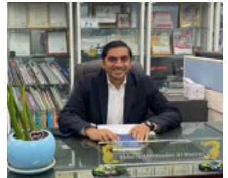
〈UAE BPC 압둘알마애니 IBITA 명예회장 취임〉