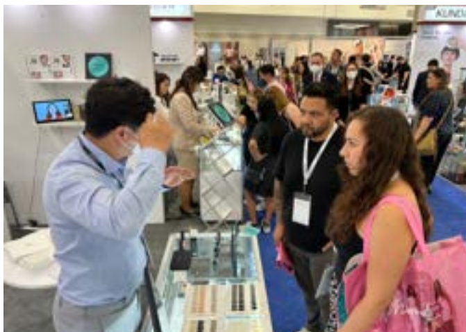
〈2022 북미코스모프로 IBITA한국관 바이어 상담 전경〉

Cosmoprof North America(CPNA)는 매년 라스 베이거스의 만달레이 베이 컨벤션 센터에서 개최되었으나 2022년~2023년 까지 라스베가스 컨벤션 센터(LVCC)에서 개최하게된다. 2022년 전시는 화장품완제품, 프로페셔널, 코스모팩으로 섹터와 홀이 나뉘어 있어 바이어의 집중도를 높였으나 코스모팩 홀과의 이동거리가 20분이상 걸리는데 바이어들의 정보 공유에 시간이 많이 소진되는 불편이 있었다. 하여, 2024년 부터는 다시 만델라베이 컨벤션센터 전시장으로 옮겨 개최하는 것으로 주최측이 최종 결정했다,