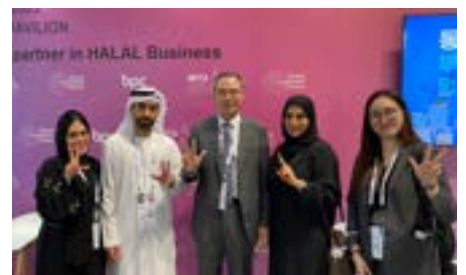
〈두바이 BPC 실무진 두바이뷰티월드에서〉