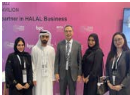
〈UAE BPC IBITA 실무책임자와 기념〉