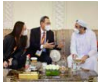
〈Duabi INDEX그룹 수석부회장과 두바이더마 행사전 환담〉