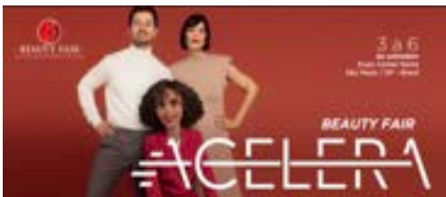
〈2023 브라질 뷰티페어 포스터〉

특히, 브라질 남성 미용제품 시장은 최근 5년간 규모가 두 배로 성장했으며, 2019년까지 7.1% 성장하며 향후 남성뷰티 제품 세계 1위 랭크 전망하고 있다고 관계자는 전했다.