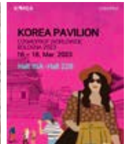
〈이태리볼로냐 코스모프르프 KOTRA & IBITA 한국국가관 홍보포스터〉