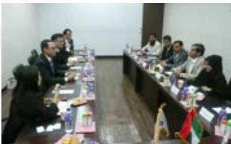
〈UAE-ESMA와 업무협약 체결위한 상호 교류회의〉