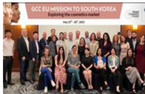
〈IBITA & FCCI 주관 GCC방문단 컨퍼런스〉