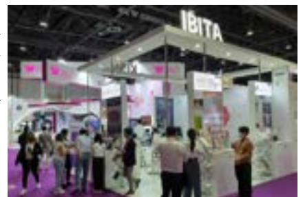
〈전시회 IBITA한국관 전경〉

인기전시품목으로는 화장품(색조, 기능성 스킨케어)/헤어제품/네일케어 및 매니큐어/스파&에스테틱/뷰티제품등이 고른 바이어들의 주목을 받고 있다.