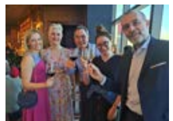
〈2022 라스베이거스 코스모프로프 임원진 네트워킹 디너행사〉