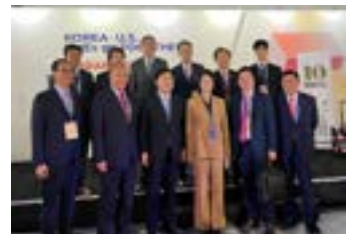
<뉴욕K-브랜드 엑스포(중앙)중소기업중앙회 김기문 회장, 중소벤처기업부 이영 장관>