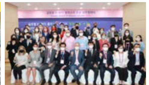
〈GCC와 충북도 & IBITA & FCCI 뷰티클러스터 조성지원 협약식〉